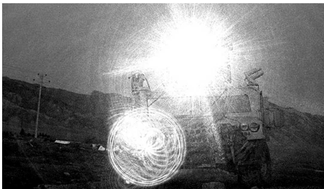
Bude budoucnost slepá?

Neusmrtit má třeba lepící pěna, použitá při stažení jednotek OSN ze Somálska. Vypadá jako stavební pěna ve spreji, kterou všichni známe. Zdáni klame. Jedná se o velmi rychle tuhnoucí lepidlo, kterým lze protivníka doslova přilepit k zemi. Jenže přesně zamířit sprejem nelze. Pokud pěna zasáhne dýchací cesty, dojde k udušení. Pokud se nepodaří zafixovat protivníkovy ruce, bude mít