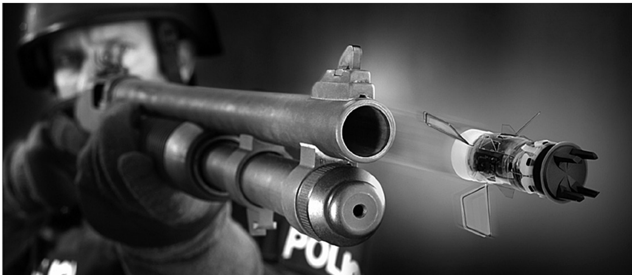
Zásah tímto taserem bude hodně bolestivý.